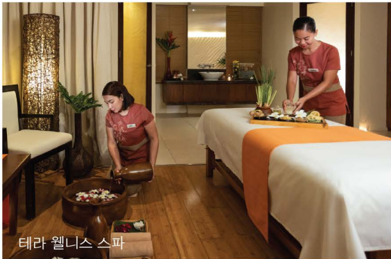
테라 웰니스 스파