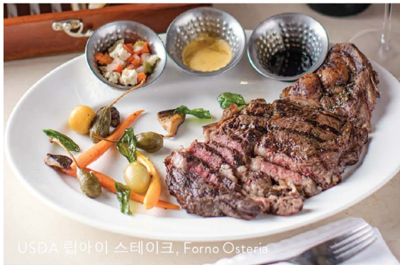
USDA 립아이 스테이크, Forno Osteria